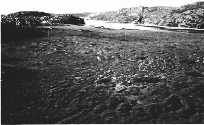
Kuva 4. Loch Laxford on esimerkiksi pienestä rimpinevasta Luoteis- Skotlannissa. Joessa hypelleitä lohia yritti moni kalastaja huijata turhaan.

Fig. 4. An example of a small flark fen in northwestern Scotland, Loch Laxford. Several fishermen were trying in vain to catch salmon in the river in the background.