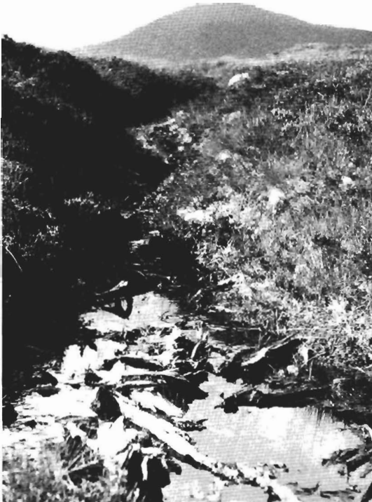
Kuva 1. Rannoch Moor Etelä-Skotlannin itäranikolla on huomattava suojelukohde. Se lienee ainoa leväkön ( Scheuchzeria palustris ) kasvu- paikka Brittein saarilla. Eroosiovaioissa näkyi runsaasti männyn ( Pinus sylvestris ) runkoja ja juurakoita.

Myös tiettyjen skottilaisten viskien valmistus kuluttaa turvevaroja. Jokainen tuikealla turvesavulla maustettu viskirankkilitra vaatii noin yhden kilon hyvin maatunutta turvetta. Keskipokoinen tislamo kuluttaa täten noin 1 700 tonnia turvetta vuodessa (Robertson 1975). Dundeen symposiumin aikana maisteltiin yhtenä iltana ohjailusti erilaisia viskilaatuja. Viimeisenä sarjassa oli turvesavulla maustettu, 12 vuotta kypsytetty Single Malt-tyyppinen viski Orkneyn saarelta. Sitä maistettuaan saattoi varmasti enemmistö osanottajista yhtyä Allen Robertsonin symposiumin päätösanoissa esittämään toivomukseen; vaikka kaikki suot Skotlannissa rauhoitettaisiin, niin jätettäisiin joku kolkka rauhoittamatta viskinmaustamistarkoituksiin!